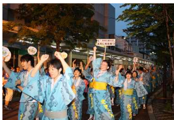
北見サンバで盛り上がる北見工大チーム